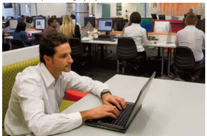
Salle d'informatique APM College, Sydney.